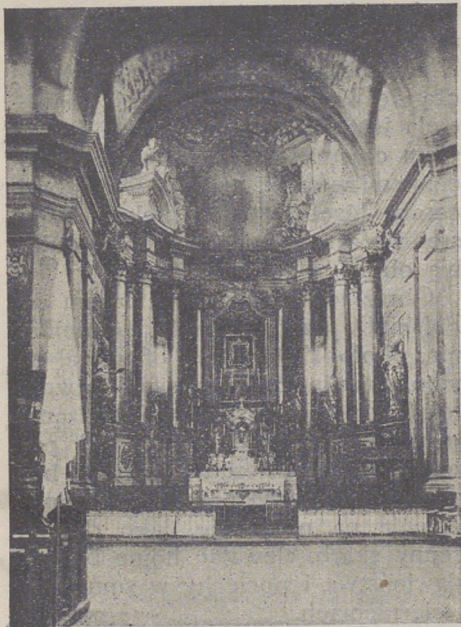
Wielki ołtarz z Cudownym Obrazem Pana Jezusa