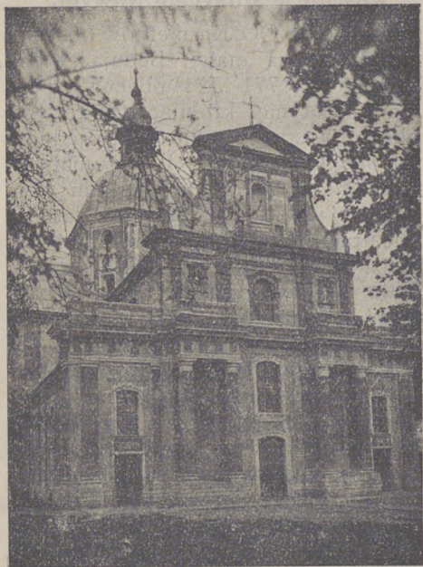
Kościół w Milatynie Nowym